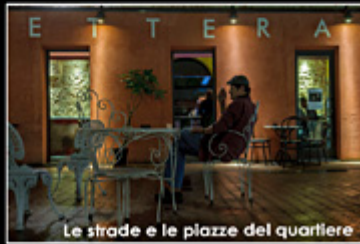
Le strade e le piazze del quartiere