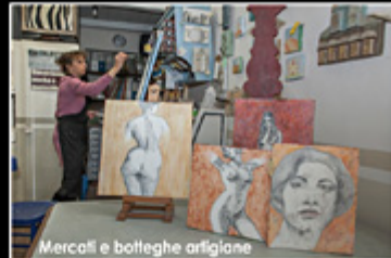
Mercoli e botteghe artigiane