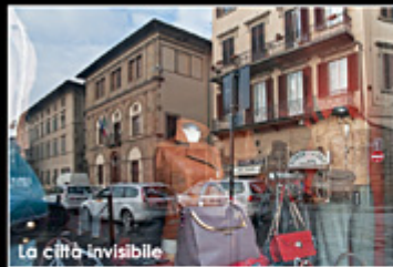
La città invisibile

DAL 15 AL 30 MARZO PRESSO SALA DELLE VETRATE AREA ESPOSITIVA EX-MURATE Giovedì - Venerdì - Sabato dalle 16.00 alle 22.00 Domenica dalle 16.00 alle 20.00