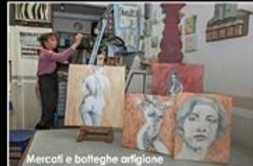
Mercoli e botteghe artigiane