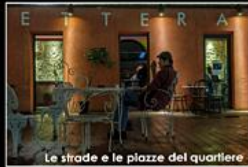
Le strade e le piazze del quartiere