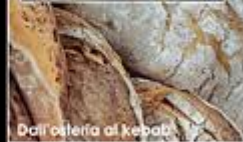
Dall'osteria al kebab