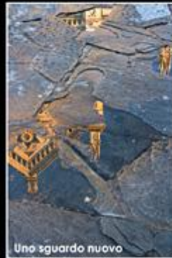
Uno sguardo nuovo

DAL 15 AL 30 MARZO PRESSO SALA DELLE VETRATE AREA ESPOSITIVA EX-MURATE Giovedì - Venerdì - Sabato dalle 16.00 alle 22.00 Domenica dalle 16.00 alle 20.00