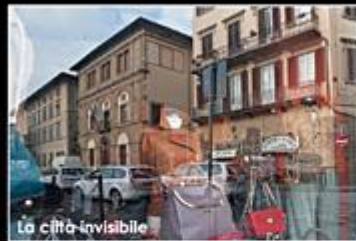
La città invisibile

DAL 15 AL 30 MARZO PRESSO SALA DELLE VETRATE AREA ESPOSITIVA EX-MURATE Giovedì - Venerdì - Sabato dalle 16.00 alle 22.00 Domenica dalle 16.00 alle 20.00